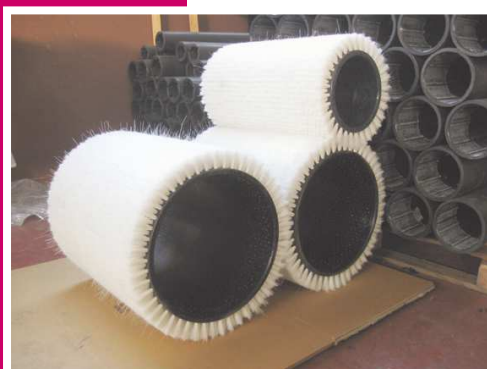
Roll 60 - seduta