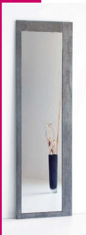
Specchio - Mira