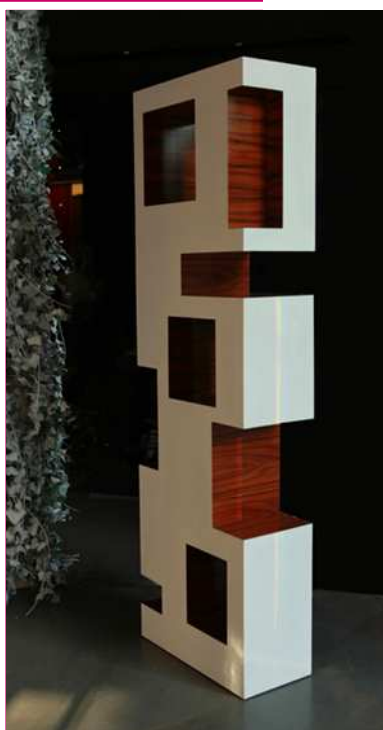
TOTEM - libreria