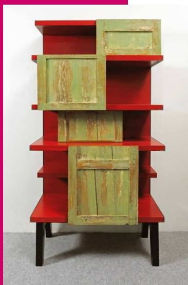
Unaportanonbasta - libreria